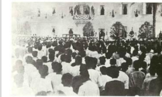
ราษฎรมาเฝ้าที่ศาลากลาง จังหวัดลำปาง

"พระบาทสมเด็จพระพุทธยอดฟ้าจุฬาโลกได้อบรมรับความสวามิภักดิ์ของชาวมณฑลพายัพที่นครลำปางนี้เป็นประภมเหตุที่บ้านเมืองทั้งมณฑลจะพ้นจากอำนาจพม่ามารวมในประเทศสยามเป็นอันหนึ่งอันเดียวกันหนึ่ง เรามาถึงเมืองนครลำปางนี้เป็นที่แรกเราได้สร้างพระแสงราชศัตราไว้องค์หนึ่งอันพระแสงราชศัตราในสมเด็จพระปิยมหาราชเจ้าอันเป็นพระบรมชนกนาถของเราได้ทรงพระราชดำริสร้างขึ้นสำหรับพระราชทานต่อพระหัตถ์