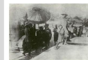
เสด็จไปหาหม่อมไฉนการจังหวัดราชชนพระแสงราชศัตรา เมืองนครลำปาง

เป็นพระมหากรุณาธิคุณอย่างยิ่งที่เมืองนครลำปางได้ถวายการรับเสด็จ พระบาทสมเด็จพระปกเกล้าเจ้าอยู่หัว รัชกาลที่ ๗ อันเป็นครั้งแรกที่พระบาทสมเด็จพระเจ้าอยู่หัวในพระบรมวงศ์จักรีเสด็จสู่นครลำปางหลังพระบรมราชาภิเษก และทรงพระกรุณาโปรดเกล้าพระราชทานพระแสงราชศัตราไว้ ณ เมืองนครลำปาง ถือเป็นหนึ่งใน ๓๒ องค์ที่ได้มีการพระราชทานไว้ยังเมืองต่างๆ